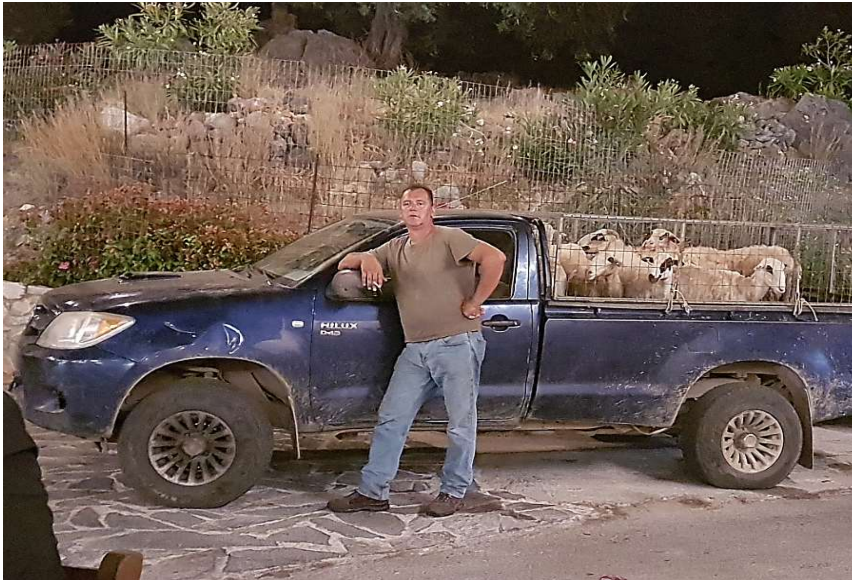
Το αφεντικό της ταβέρνας "Βίγλες" (Καψοδάσος)