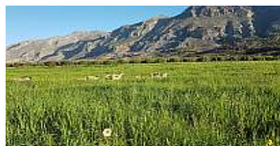
Πρόβατα στα Κολοκάσια