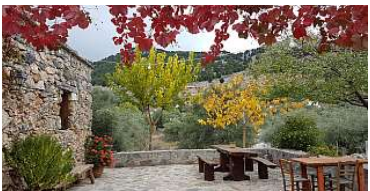
Ξενώνας Αλώνια (Άγιος Ιωάννης)