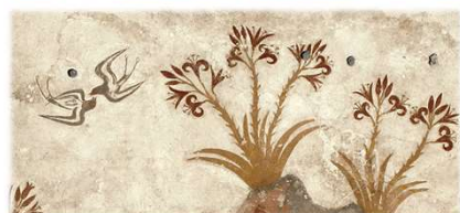
Κρίνο της θάλασσας