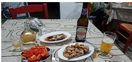
Καφενείο "Σάρισα" (Πατσιανός)