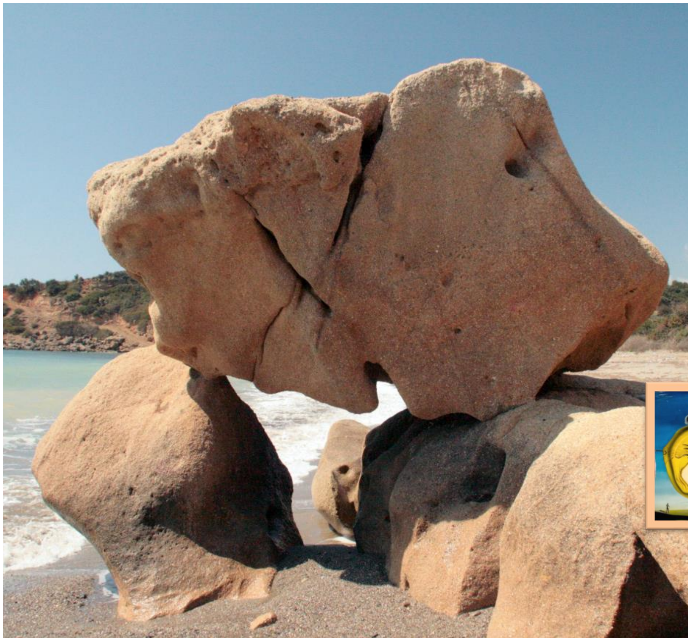
Υπερρεαλισμός στην Αγία Μαρίνα

Und wieder haben wir am sfakiotischen Gestade einen (täuschend?) echten Dalí entdeckt. Wie das Original heißt, verraten wir aus Jugendschutzgründen hier nicht. Dafür bitte unten den QR-Code scannen!