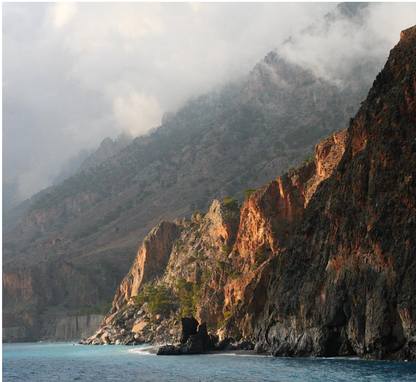
Πέρα από τη Αγία Ρουμέλη