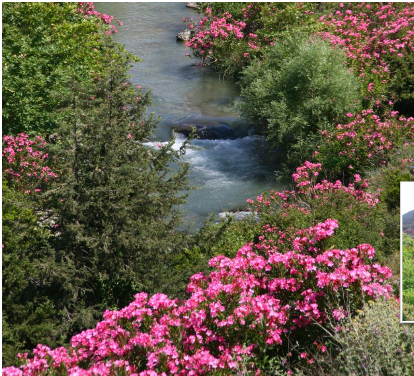
Σφάκες στην Πρέβελη και στον Πατσιανό

Im Juni blüht der Oleander - auf Griechisch πικροδάφνη (Bitterlorbeer) oder σφάκα (Sfaka). Dass sich davon der Name Sfakiá ableitet, ist eine Theorie. Eine andere verweist auf σφάζω ( sfazo = schlachten).