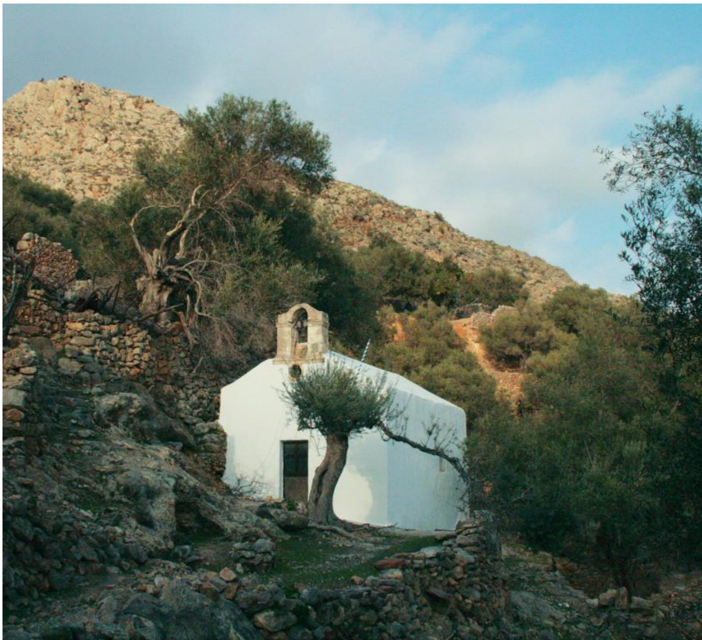
Ναός της Παναγίας (Ευαγγελισμός) στη Χώρα