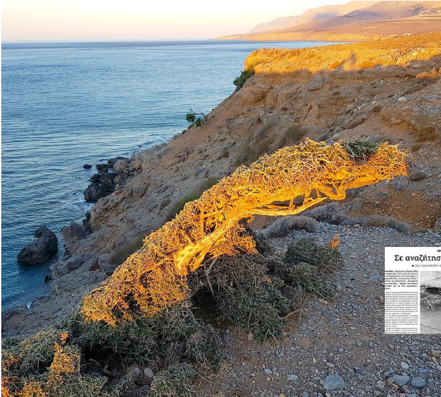
Εν αναζήτηση του κροκοδείλου