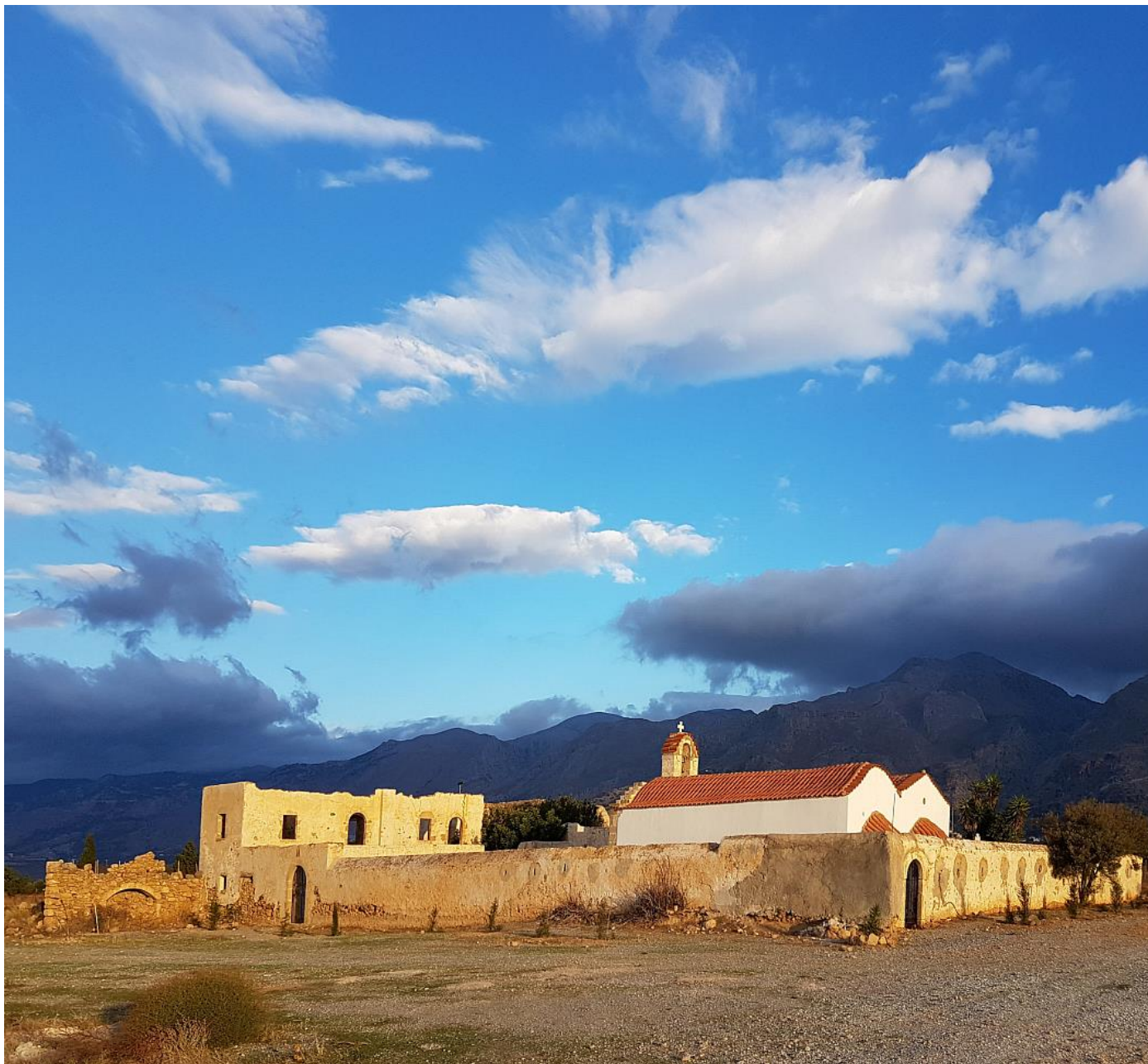
Η Μονή του ΑγίουΧαραλάμπου