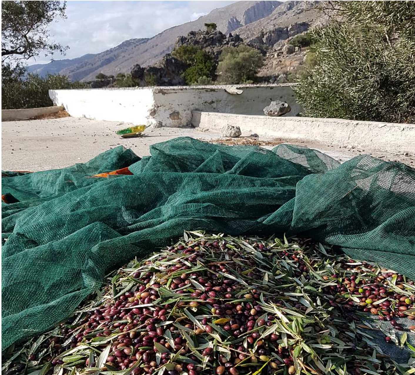
Το μάζεμα της ελιάς στο "Κέντρο" των Κολοकाσιών