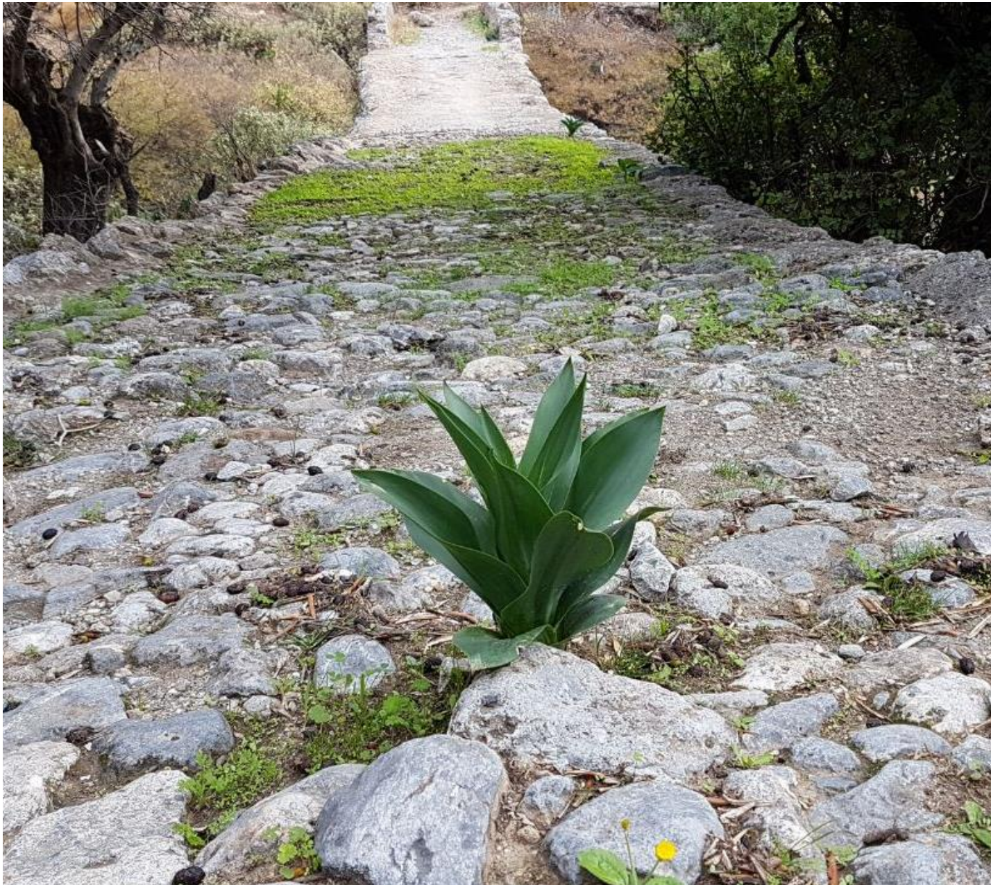
Καλντερίμι στον Πατσιανό - στο καλό να πάτε!