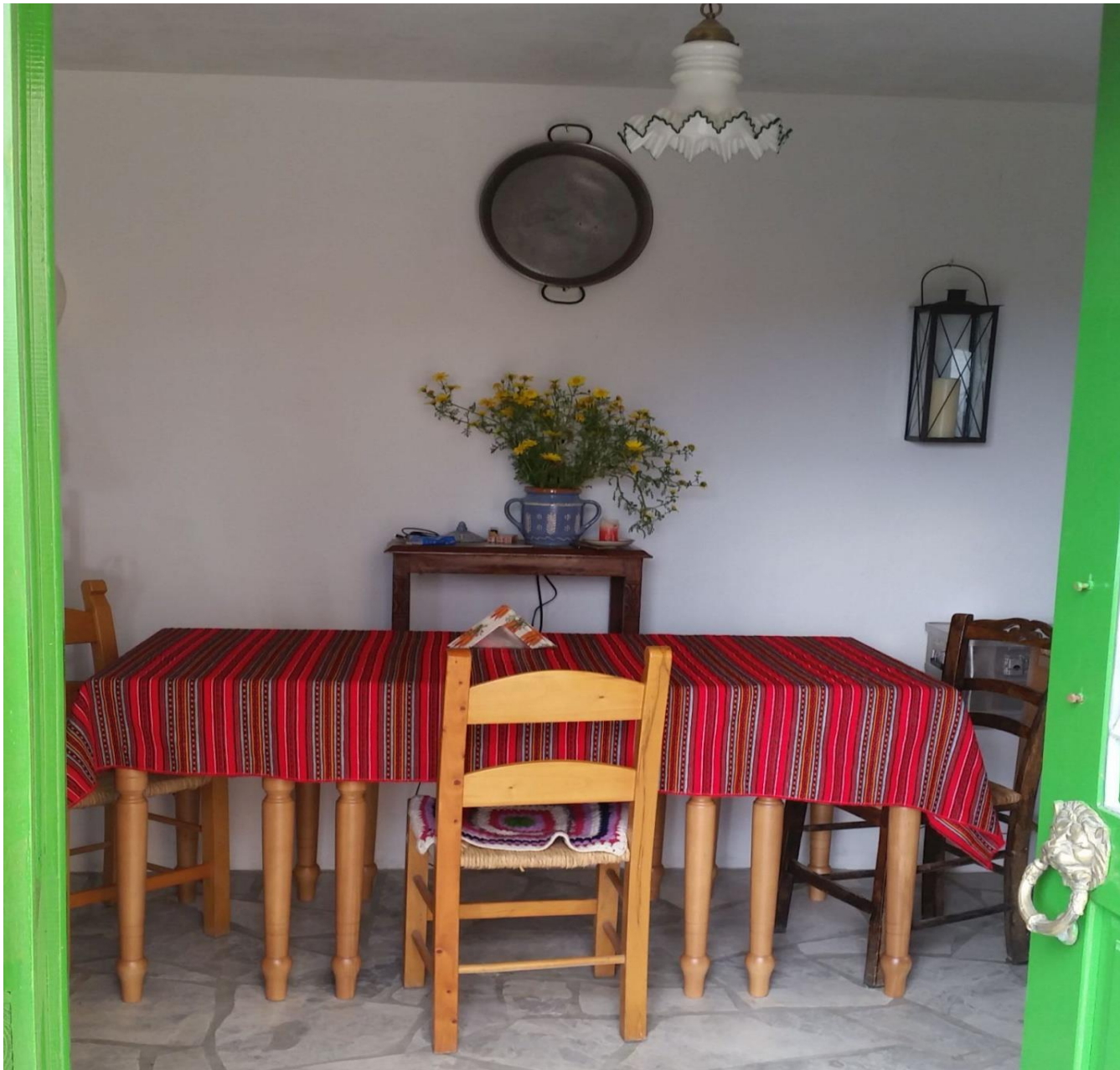
Ανοιχτές οι πόρτες!