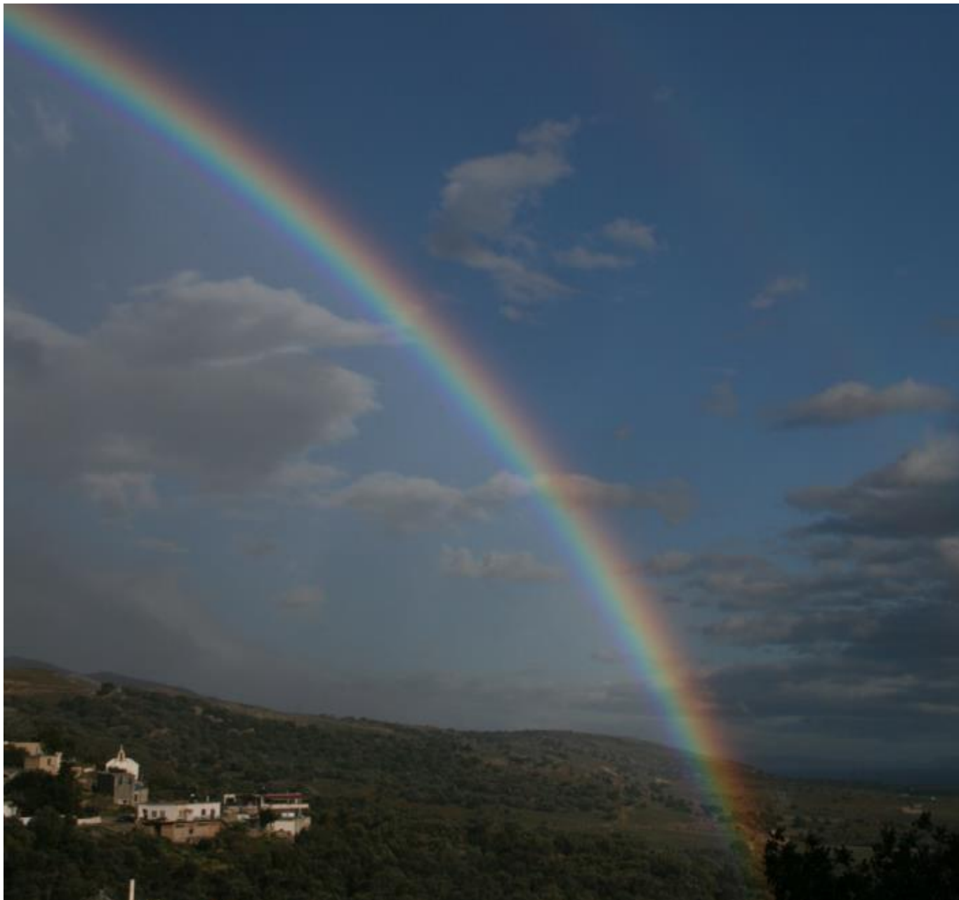
Gute Sicht nach Osten (Kapsodasos)