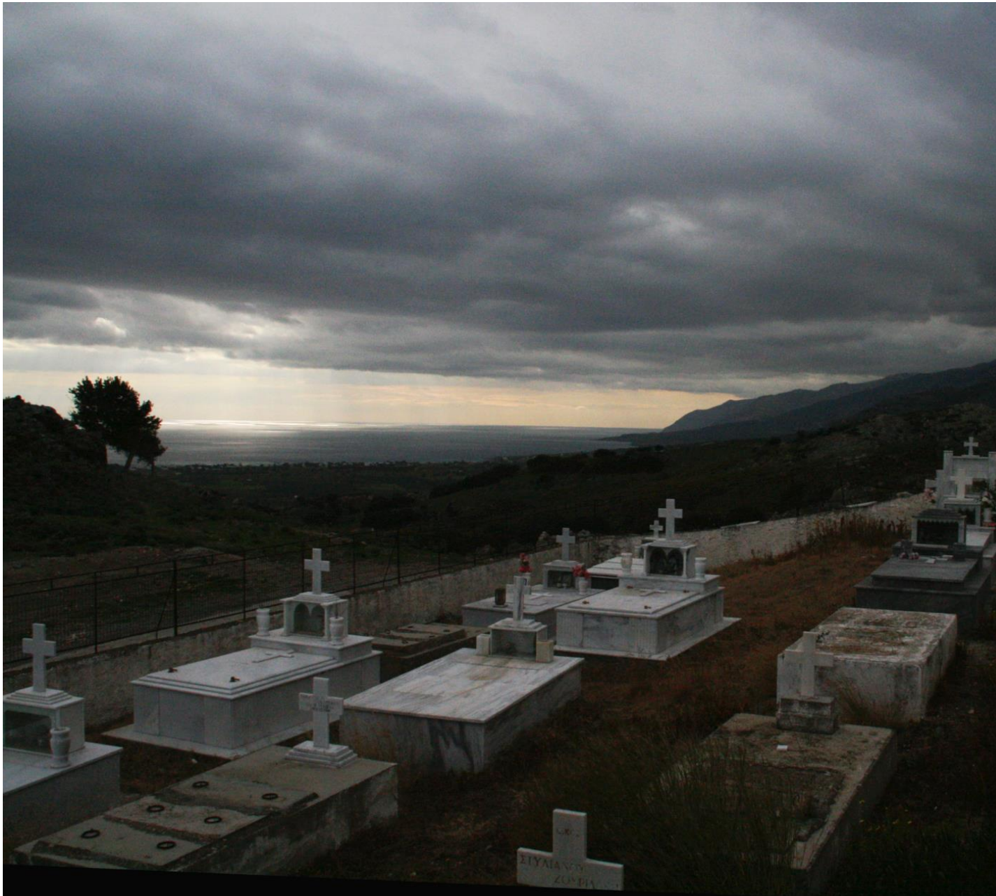
Στη μνήμη αυτών που φύγανε