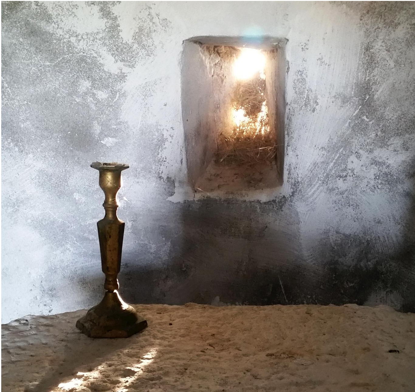
Ο Άγιος Ιωάννης