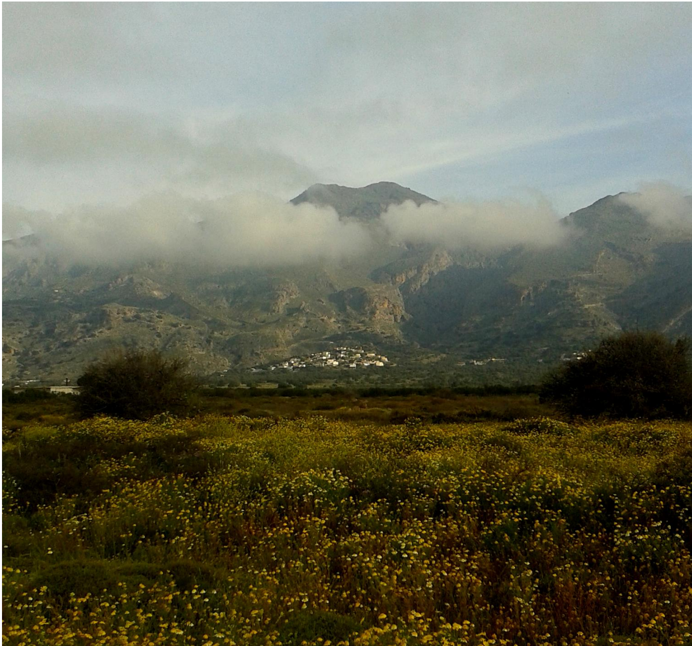
Πατσιανός και Περισυνάκι