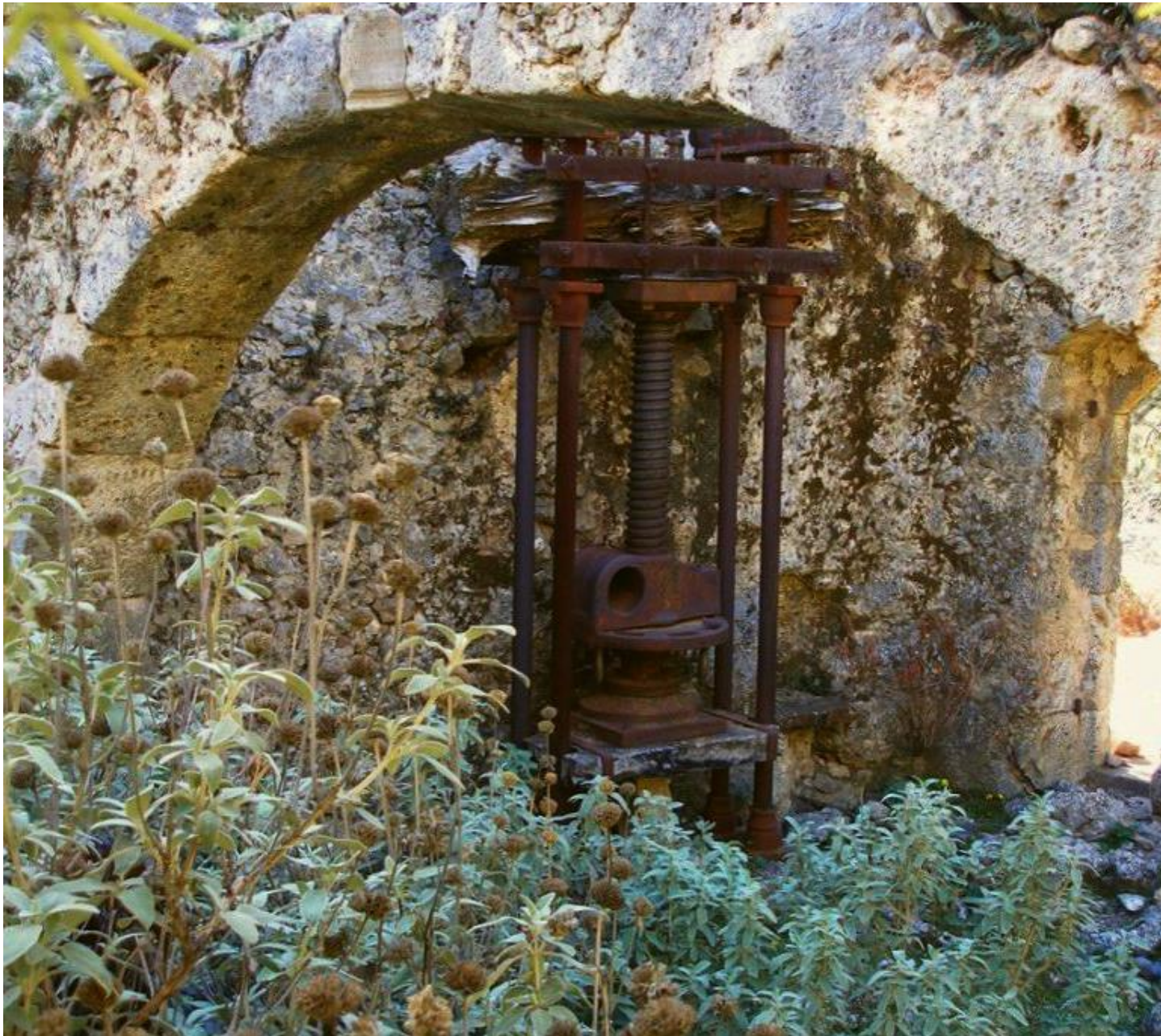
Η φάμπρικα του χωριού