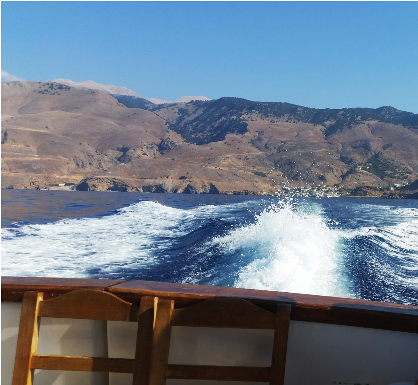
Σφακιά - Γαύδος