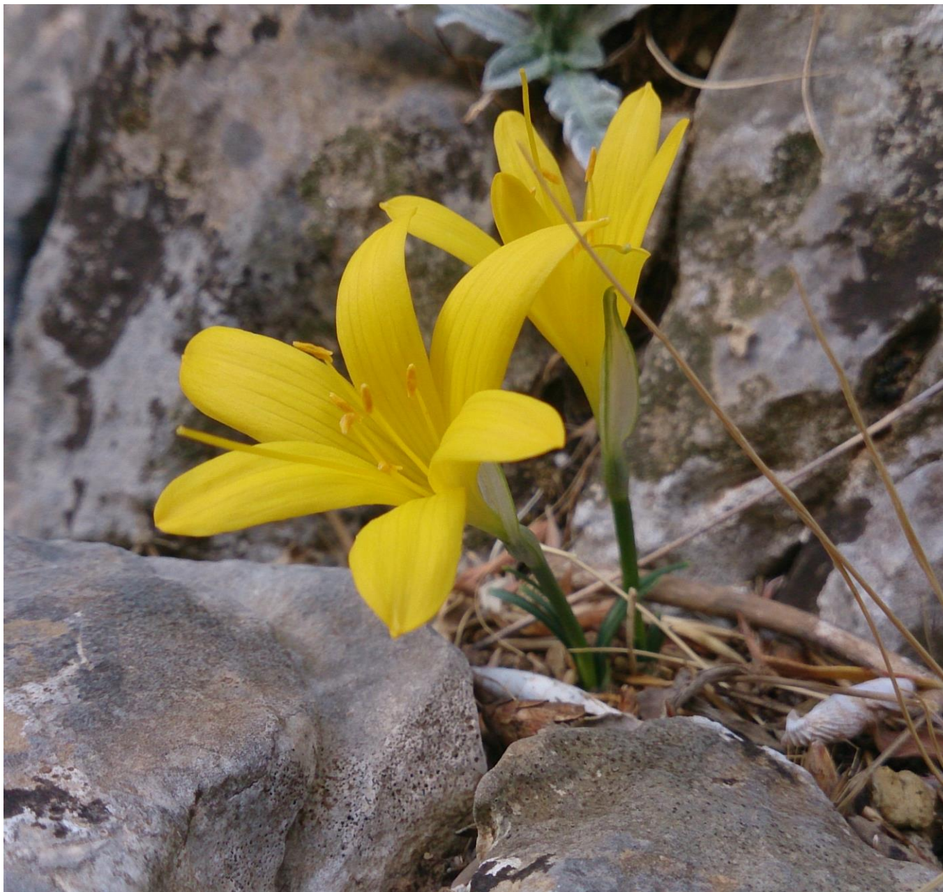
Κίτρινα κρινάκια του Φθινοπώρου στο φαράγγι