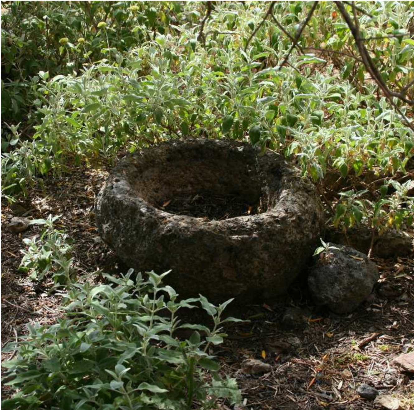
Μια παλαιά σκάφη στα Κολοκάσια