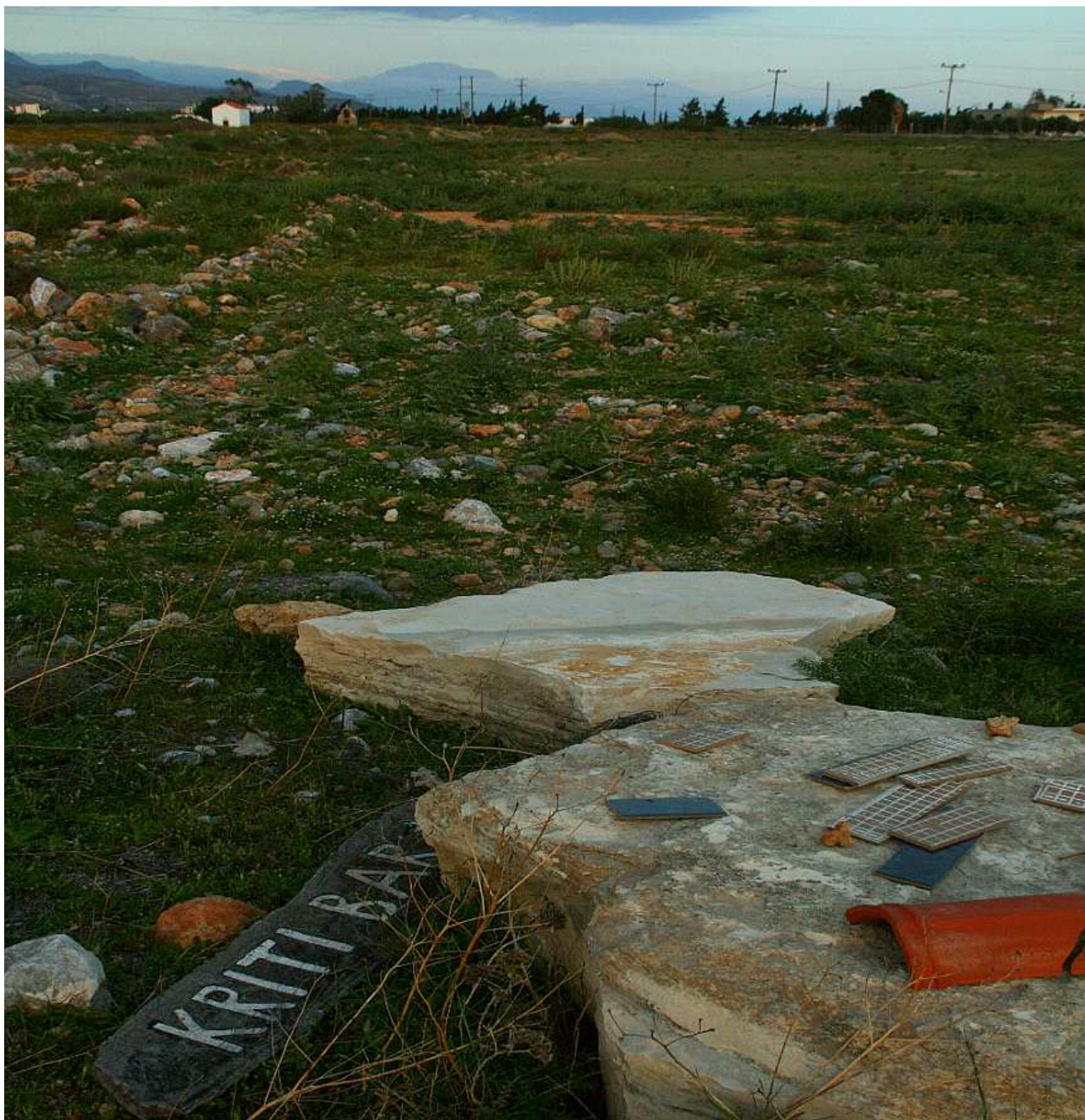
Πίσω απ' το καστέλλι