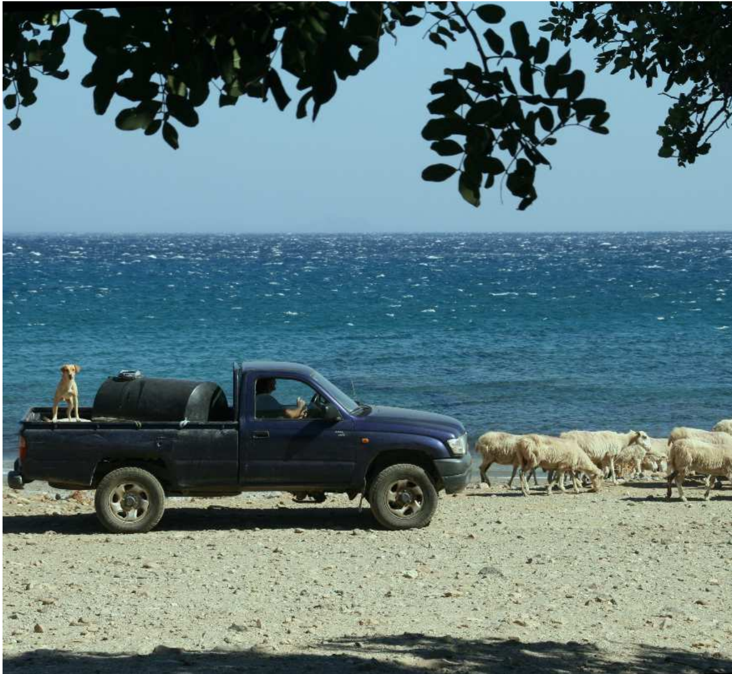
Νέος βοσκός στους Λάκκους