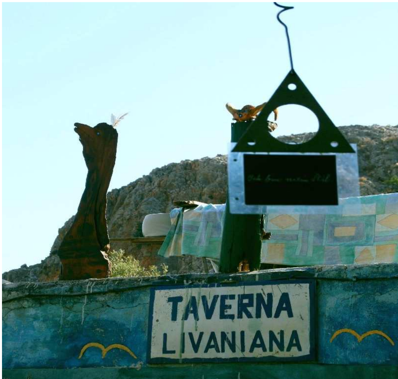
(Παρά)ξενη φιλοξενία στα Λειβανιανά