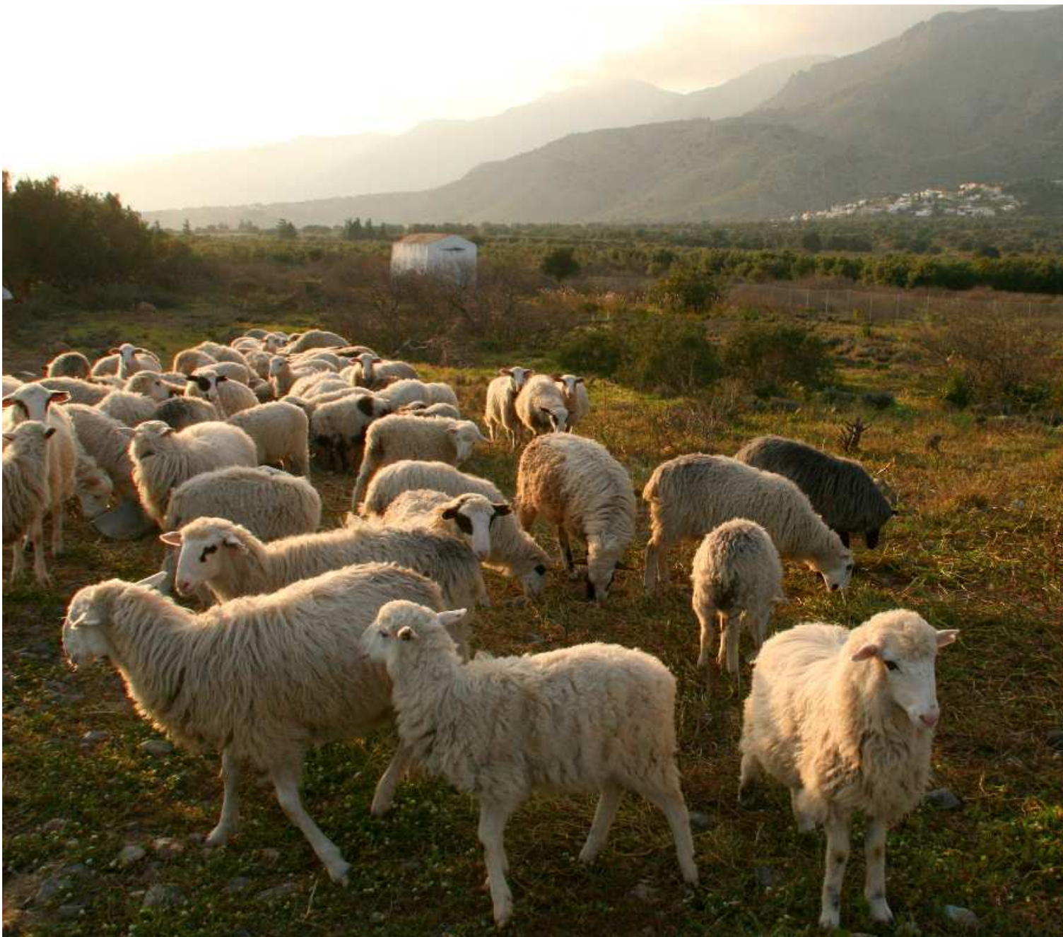
Στου Πατσιανού τον κάμπο