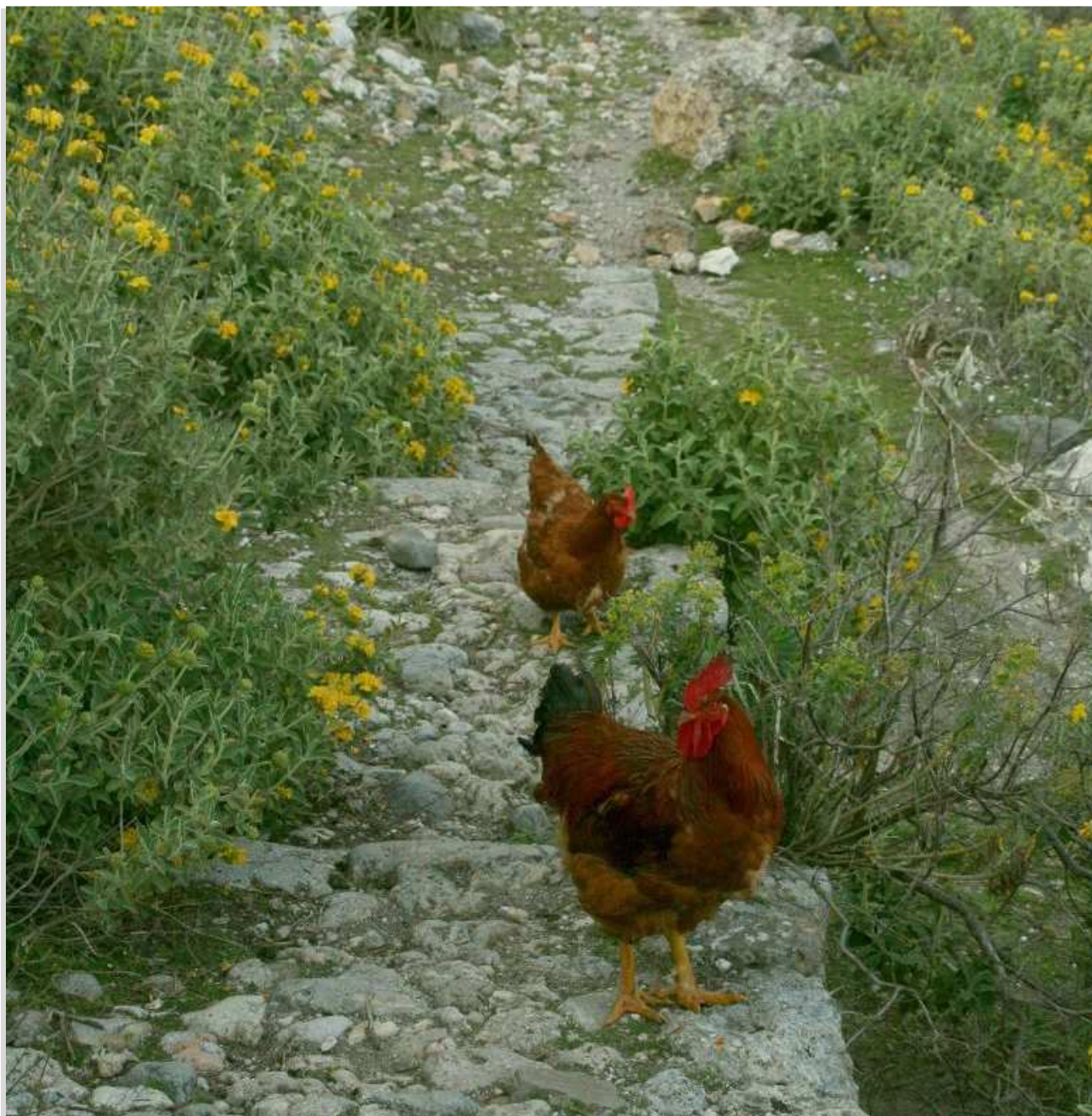
Άγρια ζωή στο χωριό