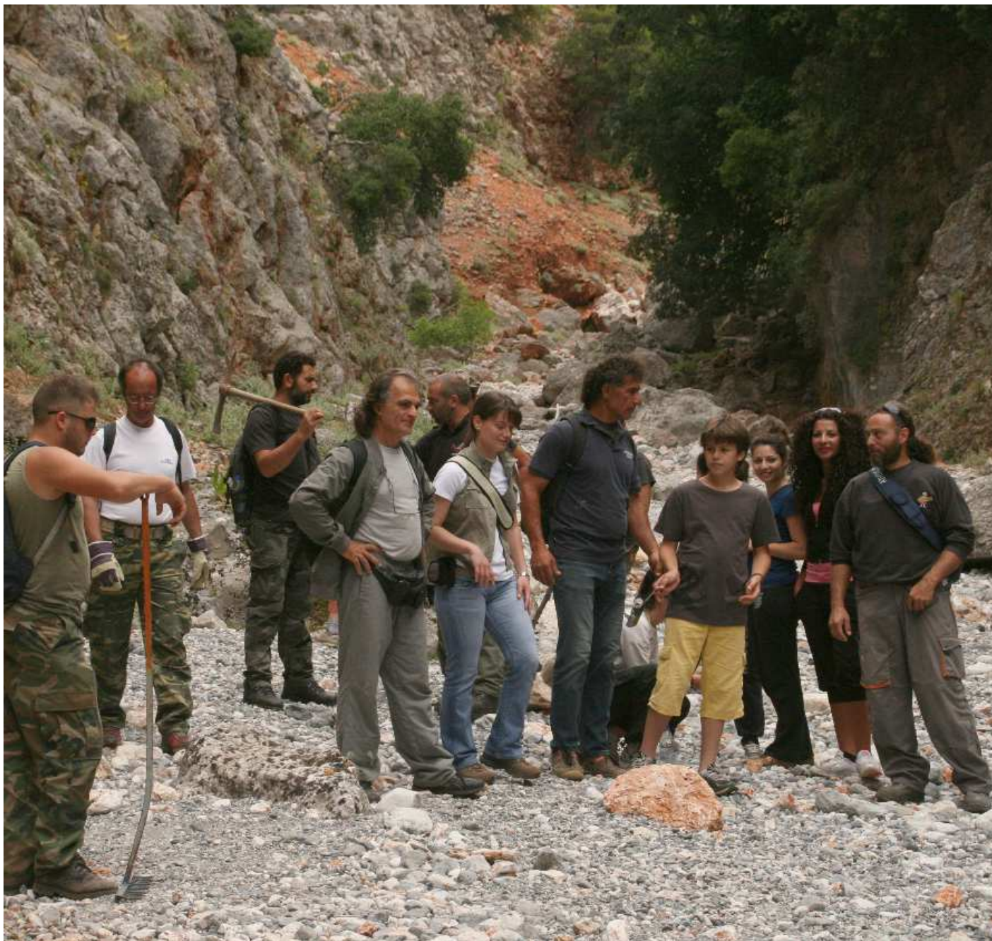
Η Πρωτοβουλία Δημωτών Σφακίων